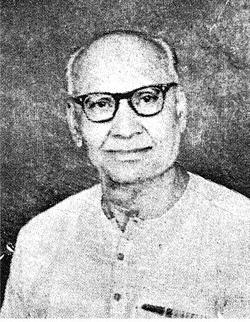
डॉ. गोविंद जयकृष्ण काळे